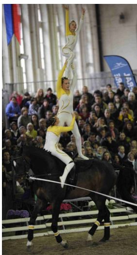
Das heutige S**-Team des RFVs Leonberg 2009 in Saumur – der Grundstein für ihren Erfolg wurde vom Ehepaar Lorenz gelegt.

Eingeladen sind S**-S*-(Junior-) sowie M*/**-Gruppen, Einzelvoltigierer und Doppelvoltigierer aus Baden-Württemberg aber auch aus anderen Bundesländern und aus dem benachbarten Ausland. Da dem Ehepaar Lorenz stets die Ausbildung der Pferde am Herzen lag findet außerdem eine Voltigierpferdeprüfung für Nachwuchspferde statt.